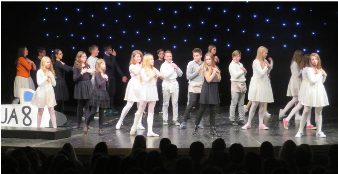
Gledališka predstava Zvezde v KC DD Zagorje

Zvezde – pravljica o vesoljni prijaznosti je gledališka predstava s petjem in plesom. Je avtorsko dramsko besedilo, ki ga je napisala Katarina Klajn. Govori o zvezdah, ki migetajo na nočnem nebu, plešejo, kramljajo in se veselijo. Pod njimi jih njihovi občudovalci Zalunci ves čas opazujejo in se po njih ravnaajo. Zelo dobro poznajo vse zvezde na nočnem nebu. Nekega dne se na njem pojavita dve novi zvezdi in ostale zvezde jima pokažejo gostoljubje. To Zaluncem ni niti najmanj všeč, zato na nebo zaveje mrzel veter in zvezde začnejo izgubljeni svojo svetlobo. Bodo zvezde s svojim žarom uspele ubraniti Vesolje pred hladom, ki je zavel z Zalunije?