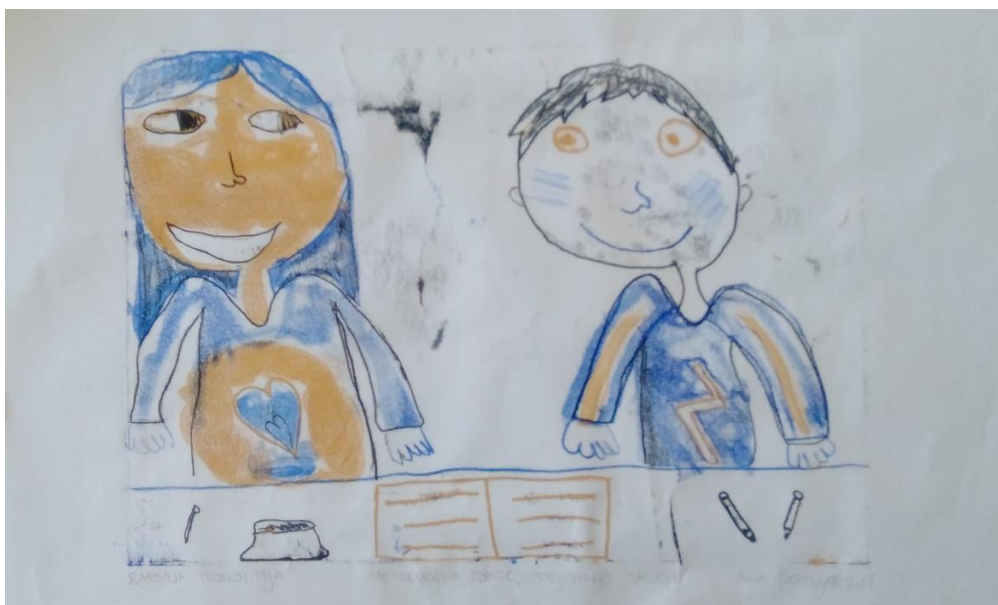
Ana Škrinjar, 2. b