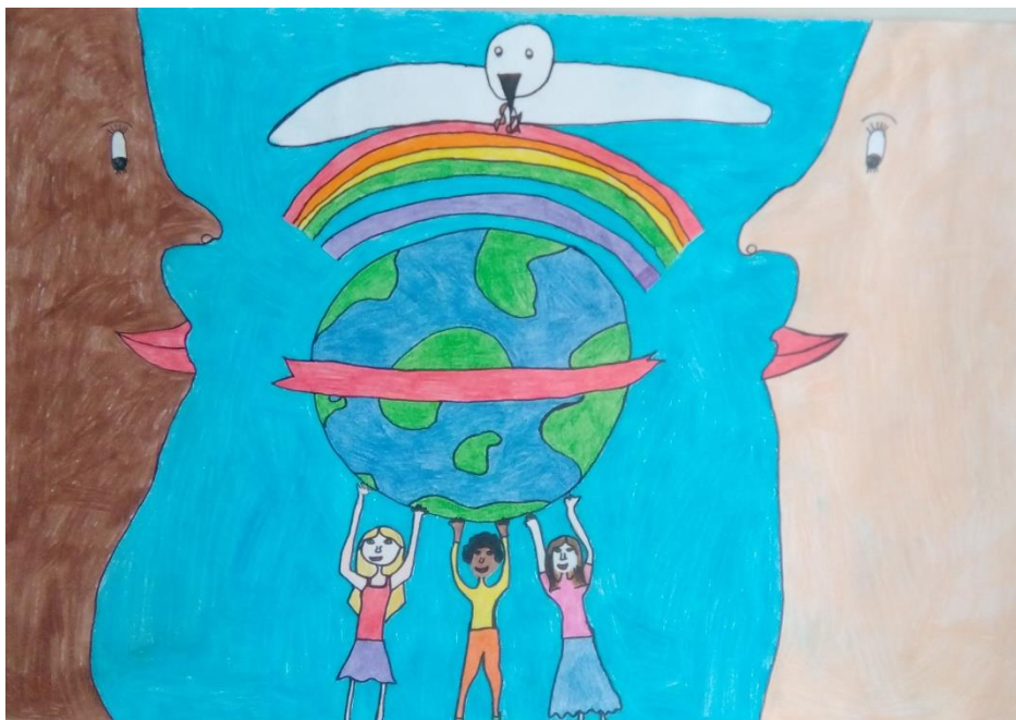
Ula Vidmar, 7. b