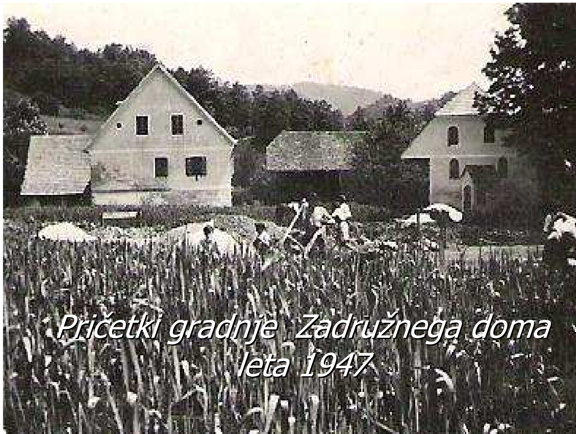
Pričetki gradnje Zadružnega doma leta 1947