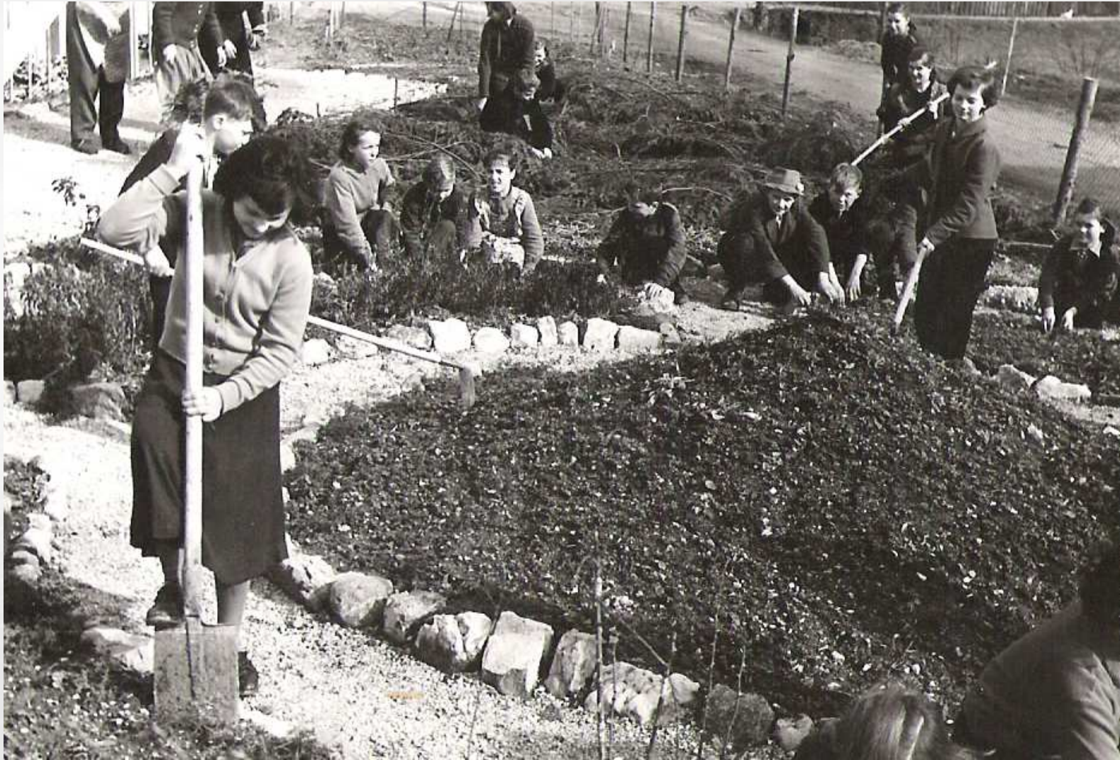
Urejanje šolskega vrta leta 1957