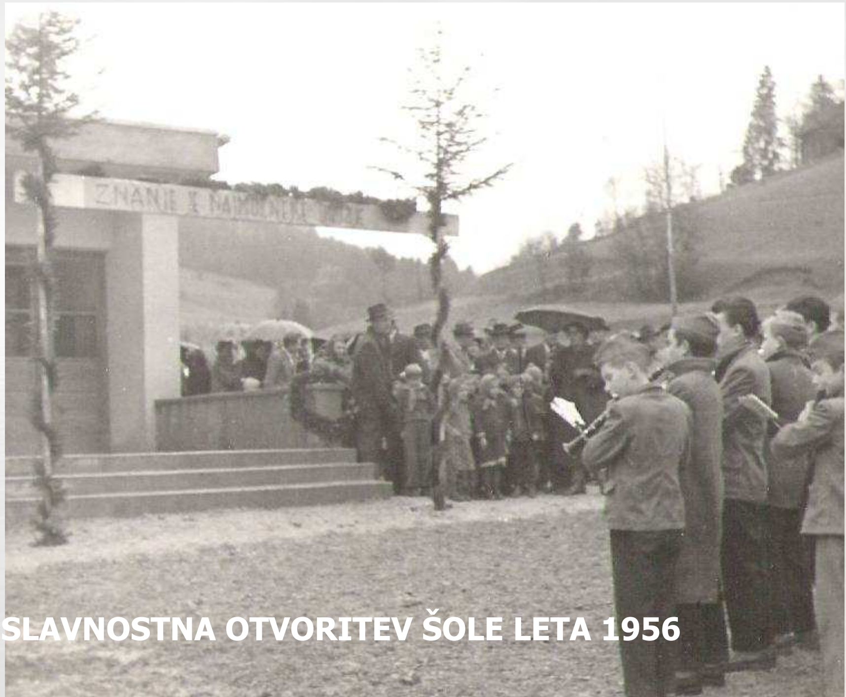
SLAVNOSTNA OTVORITEV ŠOLE LETA 1956