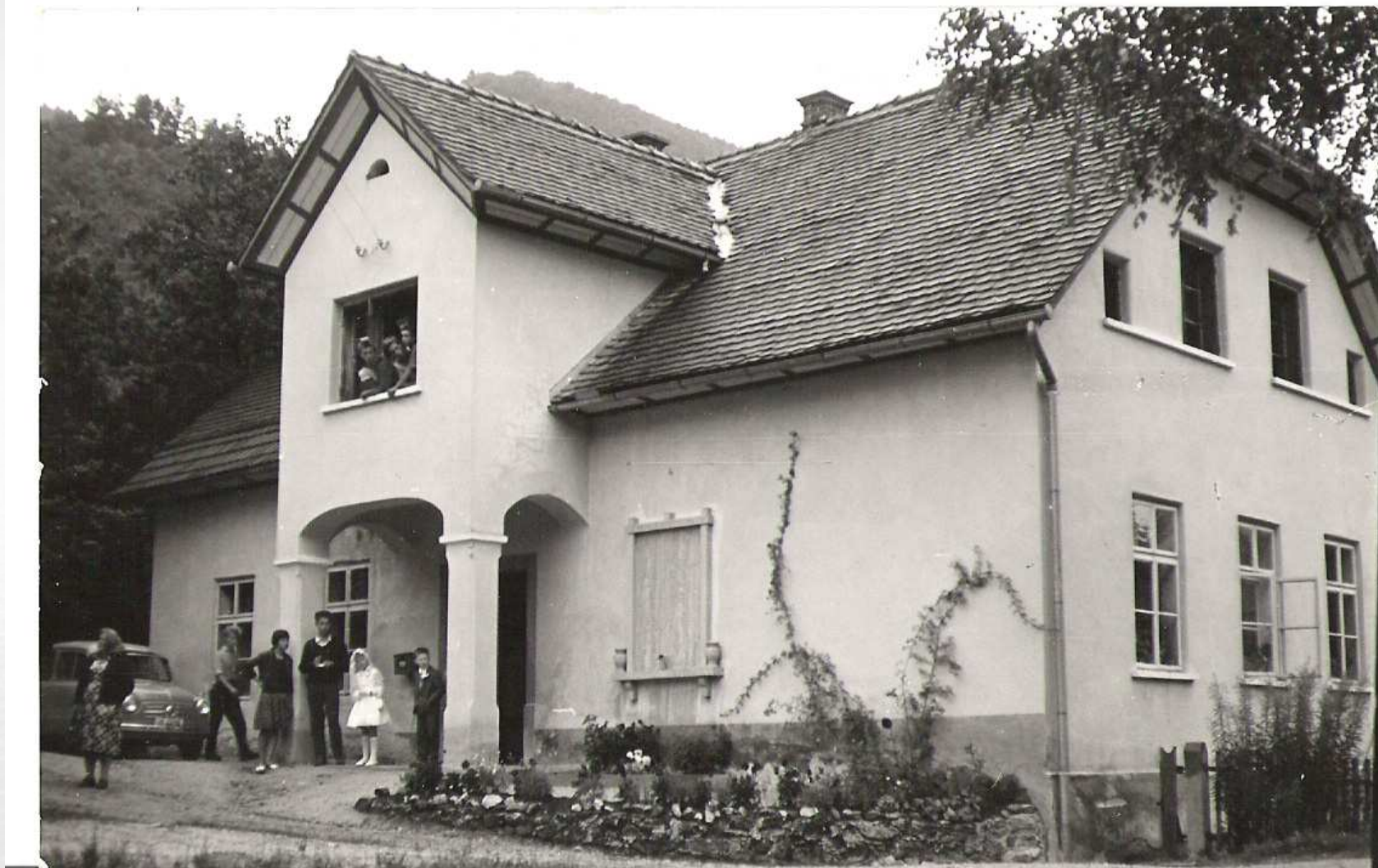
Šola v Kolovratu leta 1961