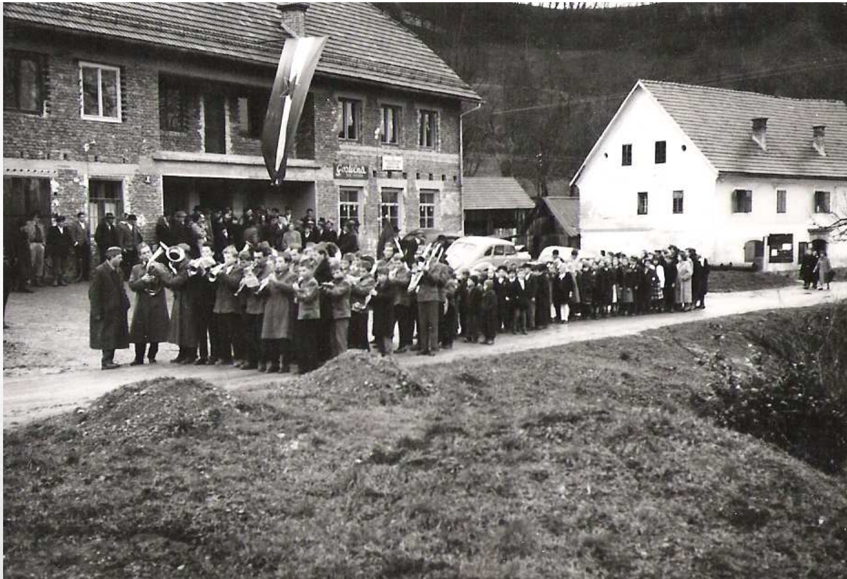
Slavnostna povorka pred Zadružnim domom, 29. 11. 1956