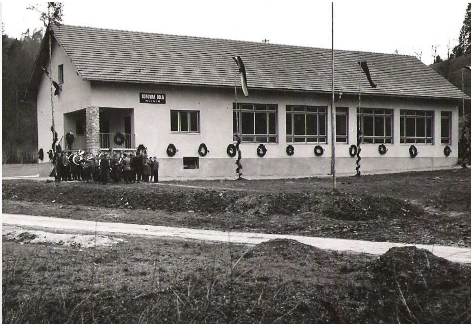
Slavnostno okrašena šola Mlinše, 29. 11. 1956