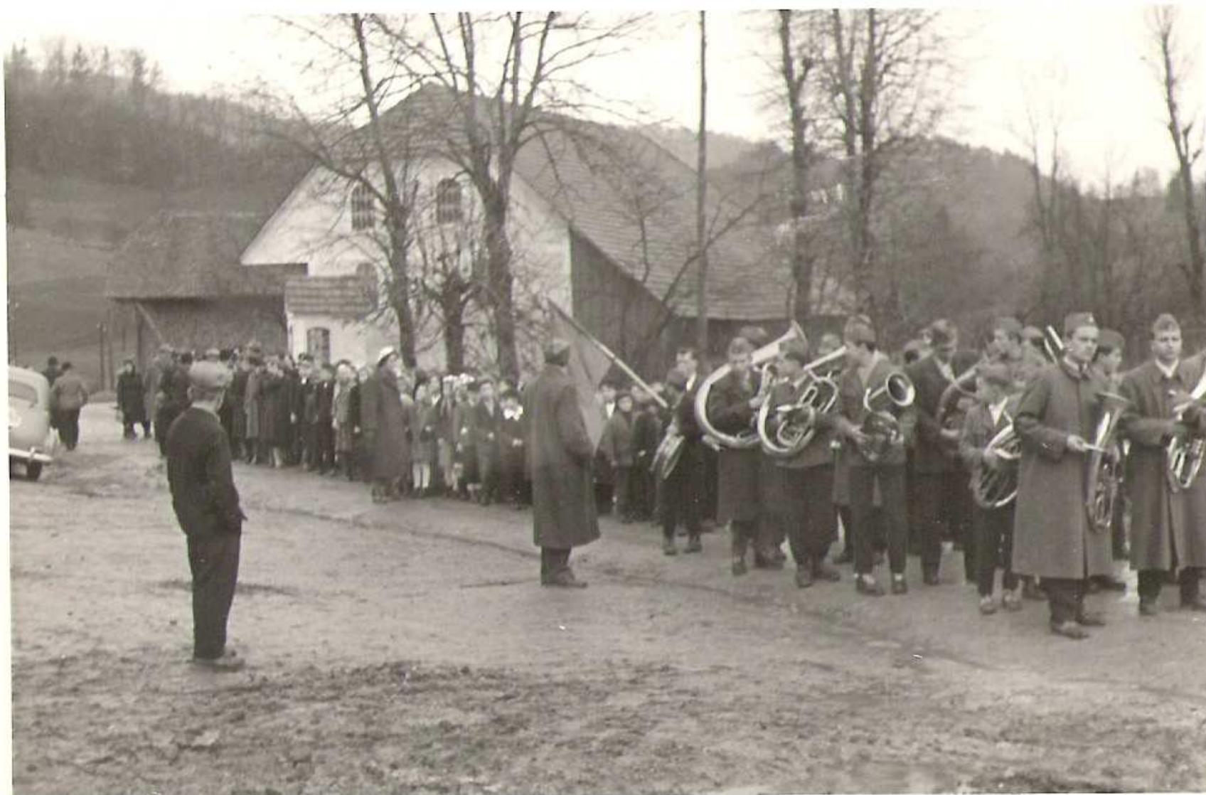
Slavnostna povorka ob otvoritvi nove šolske zgradbe na Mlinšah, 29. 11. 1956